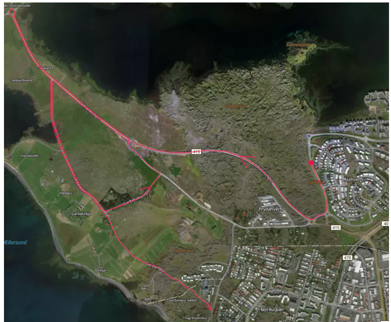
Closer look at RS-12